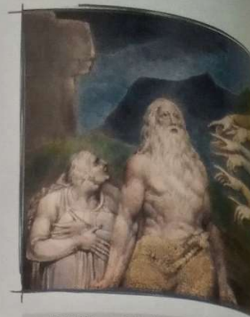
▲ William Blake [czyt.: wiliam wyszydzany przez przyjaciół]

12 a człowiek umarły nie wstanie, zbudzi się, gdy nieba nie stanie 9 , nie zdoła się ze snu ocucić.